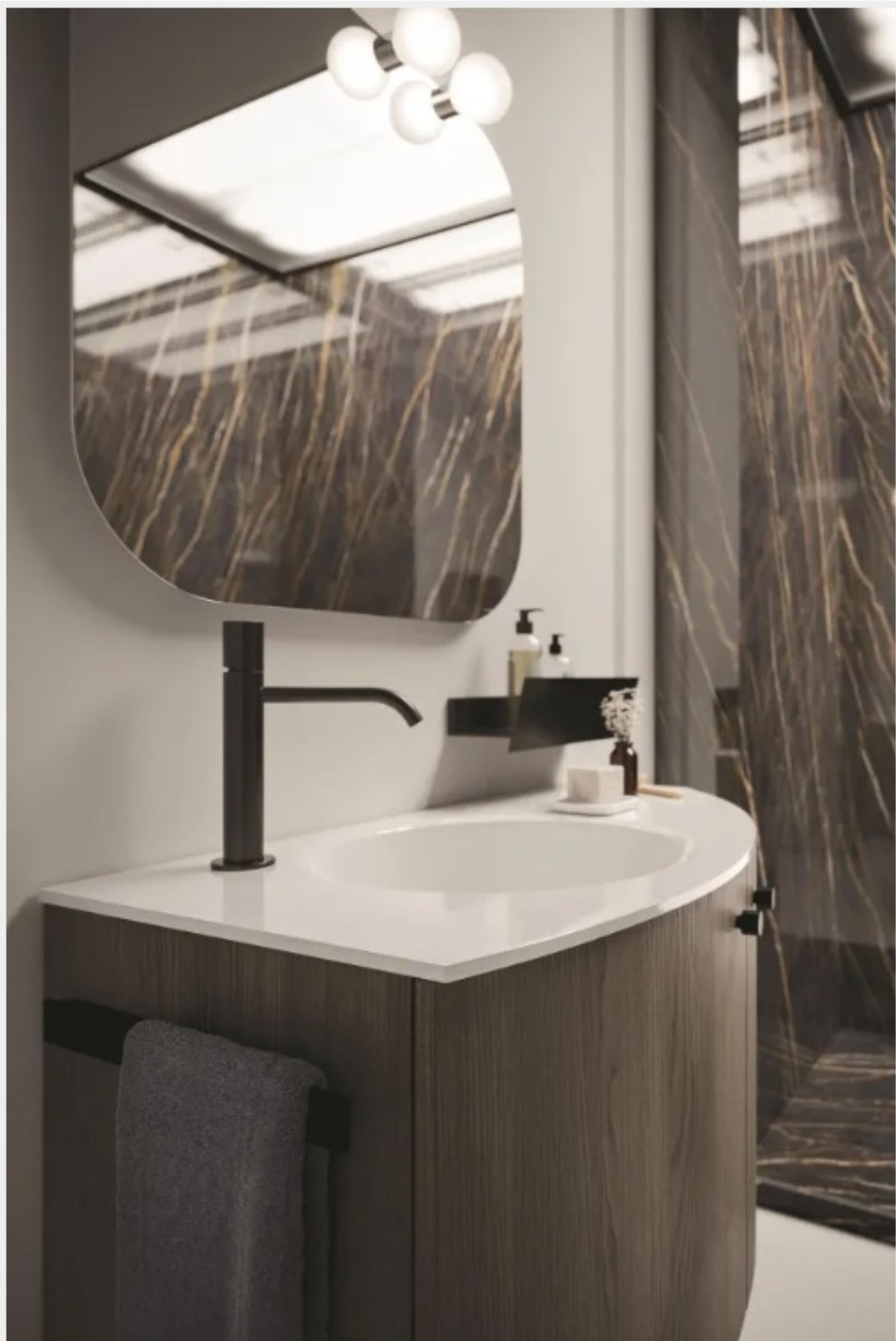
Yo-yo di Arbi Arredobagno

Nella composizione Home Plus #03 di Arbi Arredobagno è stata usata la specchiera Jolie sono fissati due faretto Yo-yo con LED a luce naturale. Ciascuno ha un diametro di 8 cm. Prezzo su richiesta. www.arbiarredobagno.it